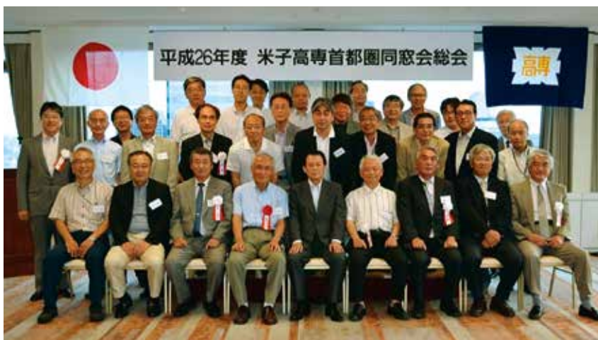
写真1：第6回総会・懇親会出席者