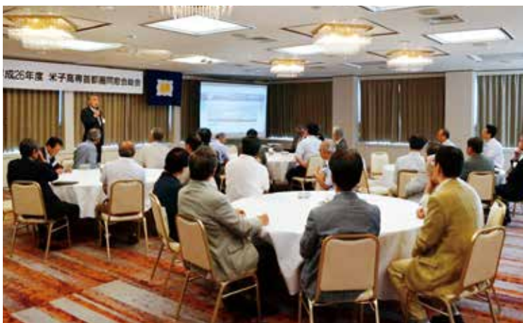
写真2：総会開催風景

会則に「会員相互の親睦と向上を図り、母校の発展に協力すること」と目的を謳っており、実行するため「身の丈に合った」「迅速な行動」「会員の自由を尊重」など、無理をしない会の運営を方針としています。